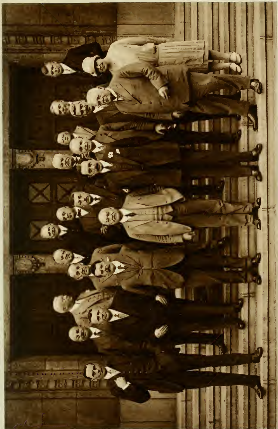
Besprechung deutscher und englischer Industrieller in Leverkusen vom 11. — 13. Juni 1927.